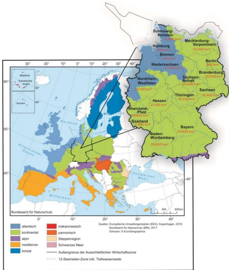
Abbildung 3: Die biogeografischen Regionen Europas und Deutschlands

Quelle: Bundesministerium für Umwelt, Naturschutz und Nukleare Sicherheit, - Bundesamt für Naturschutz. 2020. Die Lage der Natur in Deutschland: Ergebnisse des EU-Vogelschutz- und FFH-Berichts.